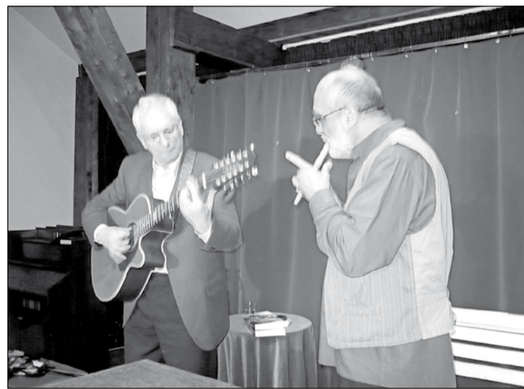
A Gryllus-Radványi duó méltóképpen zárta az első napi ünnepséget