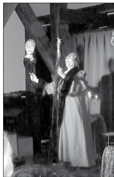
Varga Vilmos egyik jelenetsora