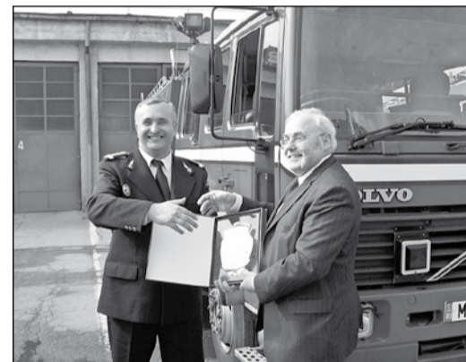
Miniszterelnöki látogatás a tűzoltóknál