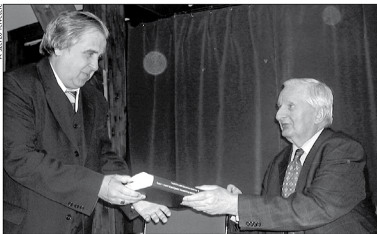
Pmogáts Béla dedikálta a helyszínen a könyveket

keli az erdélyiséget, a helikoni hagyományokat, sok olyan írást olvasott, melyben az erdélyi tudatot kérdőjelezték meg. Ezt tapasztalta a mostani turné kolozsvári állomásán is, ahol a fiatalabb generáció idegenkedve fogadta a hagyományos módon megírt, irodalomtörténeti művet. „Arra biztatom az itteni írókat, hogy őrizzék meg saját lelkületüket, erdélyiként vagy dunántúliként nem kell párizsian viselkedni” – mondta Pomogáts Béla.