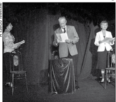
Rendületlenül címmel szerveztek megemlékezést

„Jogos harc sosincs hiába” hangzott el mindjárt az emlékműsor elején, hiszen „csak akkor születnek nagy dolgok, ha bátrak voltak, akik mertek”. A közreműködő színészek összekötő szöveg