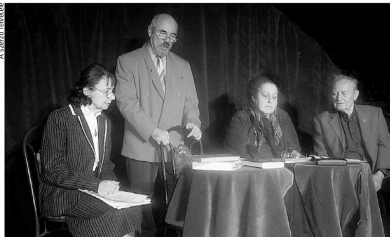
Az Illyés Gyula emlékére rendezett nagyszerű est főszereplői

CD-ről hallgathattunk meg egy részletet a költő egyik nagy verséből Egy mondat a zsarnokságról címűből, melyet a költő az 50-es évek elején írt. Befejezőként Meleg Vilmos nagy átérzéssel, szenvedélyesen szavalta el a költő Bartók című versét. Egy újabb csodálatos est végén, újfent felcsendült a vastaps, a közönség felállva ünnepelte a színművészeket, a meghívott vendéget.