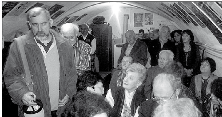
Sokan eljöttek szerda este a Kiss Stúdió színháztermébe