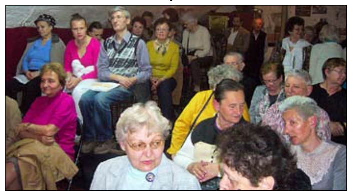
A közönség egy része, ők általában mindig jelen vannak a műsorokon

rendezője, a varsói Nowy Teatr (Új Színház) igazgatója jegyezte. A színházi világnapot 1962. március 27-én ünnepelték meg először és azóta minden évben egy-egy jelentős alkotót kérnek fel, hogy fogalmazza meg a világnapi üzenetét, melyet több nyelvre lefordítanak, közzéteszik a médian keresztül, és a világ számos