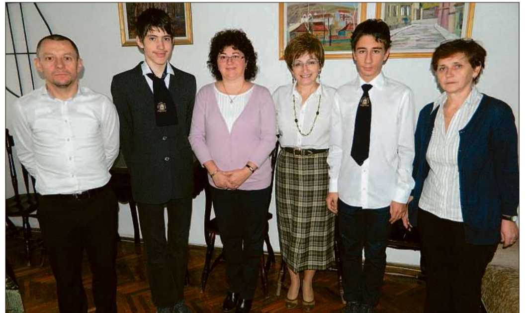
A képen a nagyváradi Ady Endre Líceum díjazott diákjai és felkészítő tanáraik láthatóak

Az igazgatónő jelezte, hogy a Bolyai Matematika Csapatverseny helyi fordulóján az Ady Endre Líceum négy csapata jutott ki az országos versenyre, amelyet ezen a hétvégén bonyolítanak le Budapesten, múlt pénteken pedig Nyíregyházán vettek részt