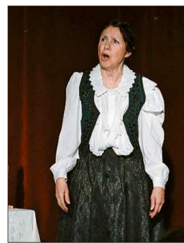
Nagy tapsal és virágcsokorral jutalmazta a hálás közönség a művésznő kitűnő játékát

dett szülőben lévő kunyhó”, olyan magányossá lett, de ebben a lelki állapotában talált menedéket hitében, még ha sokszor perelnie is kellett az Istenel. Szuggesztív rendezői megoldásnak tűnt, hogy meghalt családtagjai emlékére kis méretű kopjafákat állított a színpadon elhelyezett díszlet-asztalra, mely így családi temetővé vált. Elhunyt férjének juszt követelő családtagjaival dacolva, Kata megmaradt egyházát védelmező, iskolákat gyarapító, könyveket megjelentető és ajándékozó, árvákat pártoló nemeslelkű asszonynak, akit nem tört derékba sok nyomorúsága.