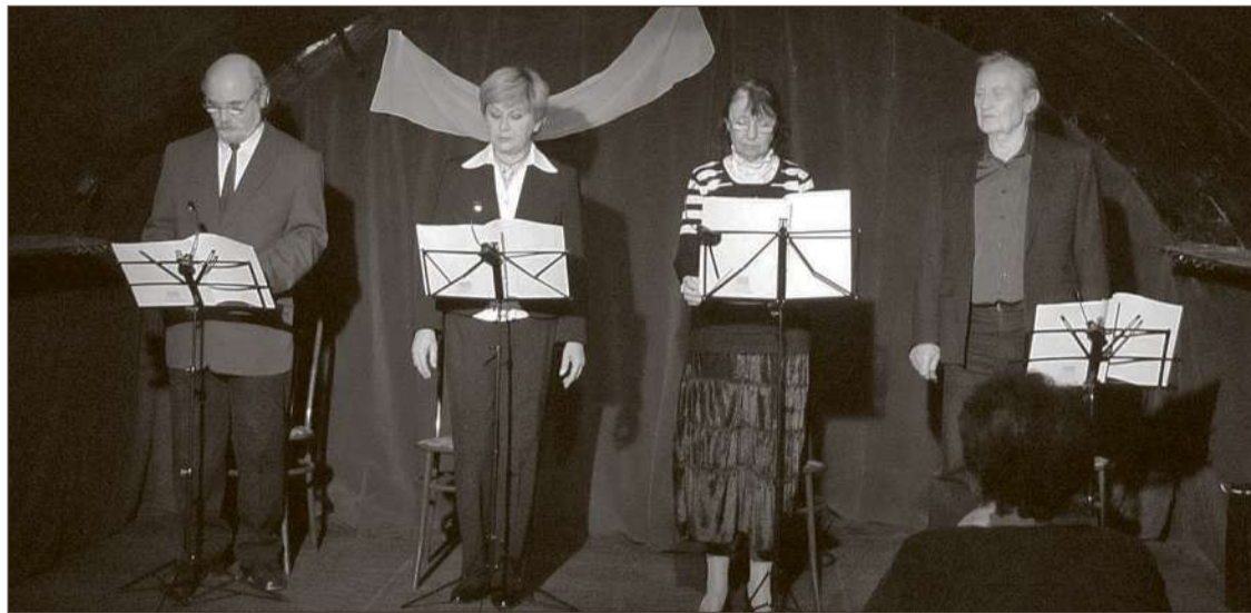
Babits Mihály A második ének című mesedramáját adták elő a nagyváradi Kiss Stúdióban kedden este

A könyv előszavában felesége részletesen leírta a mesedrá-